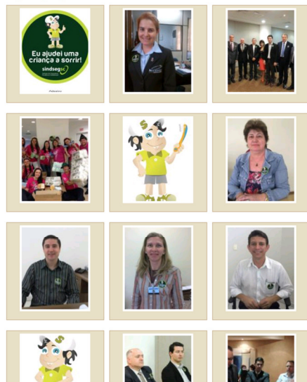
14.11.2013 - Um Sorriso pode mudar o mundo - Parte II