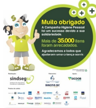
Banner Web 1: